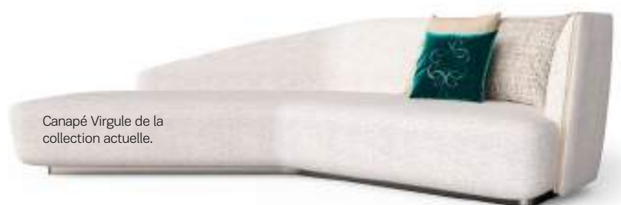
Canapé Virgule de la collection actuelle.

Depuis deux ans, Elie Saab propose également des meubles et des accessoires, réalisant ainsi un rêve ancien. Le premier showroom d'Elie Saab Maison a ouvert ses portes à Milan, deux autres suivent cette année à Paris et à Beyrouth. Les meubles, les tapis, les textiles d'intérieur, les luminaires et les objets en verre traduisent le style de mode opulent du designer dans l'univers intérieur et se distinguent par une attention aux détails et matériaux précieux, par des volumes voluptueux. «Mon appartement me reflète en tant que personne privée, dit Elie Saab. La nouvelle ligne Maison représente un style de vie en accord avec les collections.» Pour