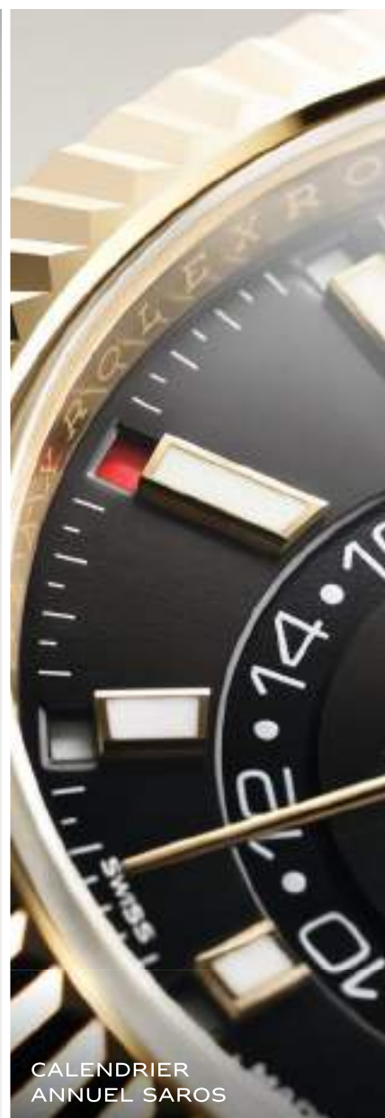
CALENDRIER ANNUEL SAROS