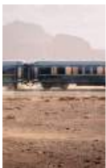
Codes de l'époque en version modernisée, le mythique train fonce vers le futur.

Inutile de se réjouir trop vite, le palace roulant qu'est l'ancien-futur train Orient-Express La Dolce Vita ne touchera pas les rails avant 2025. Mais comment résister à l'envie de montrer déjà les images d'ambiance de ce que sera cet emblème du voyage luxueux? Montée par le groupe Accor, le géant de l'hôtellerie propriétaire de la marque, une exposition immersive vient de présenter ce nouveau décor à Paris, avant de le montrer, début décembre, à Design Miami/. De quoi est-il donc question? Le mythique train qui fait fantasmer les lecteurs d'Agatha Christie s'est lancé autour du monde en 1883, sous l'impulsion d'un esthète hédoniste,