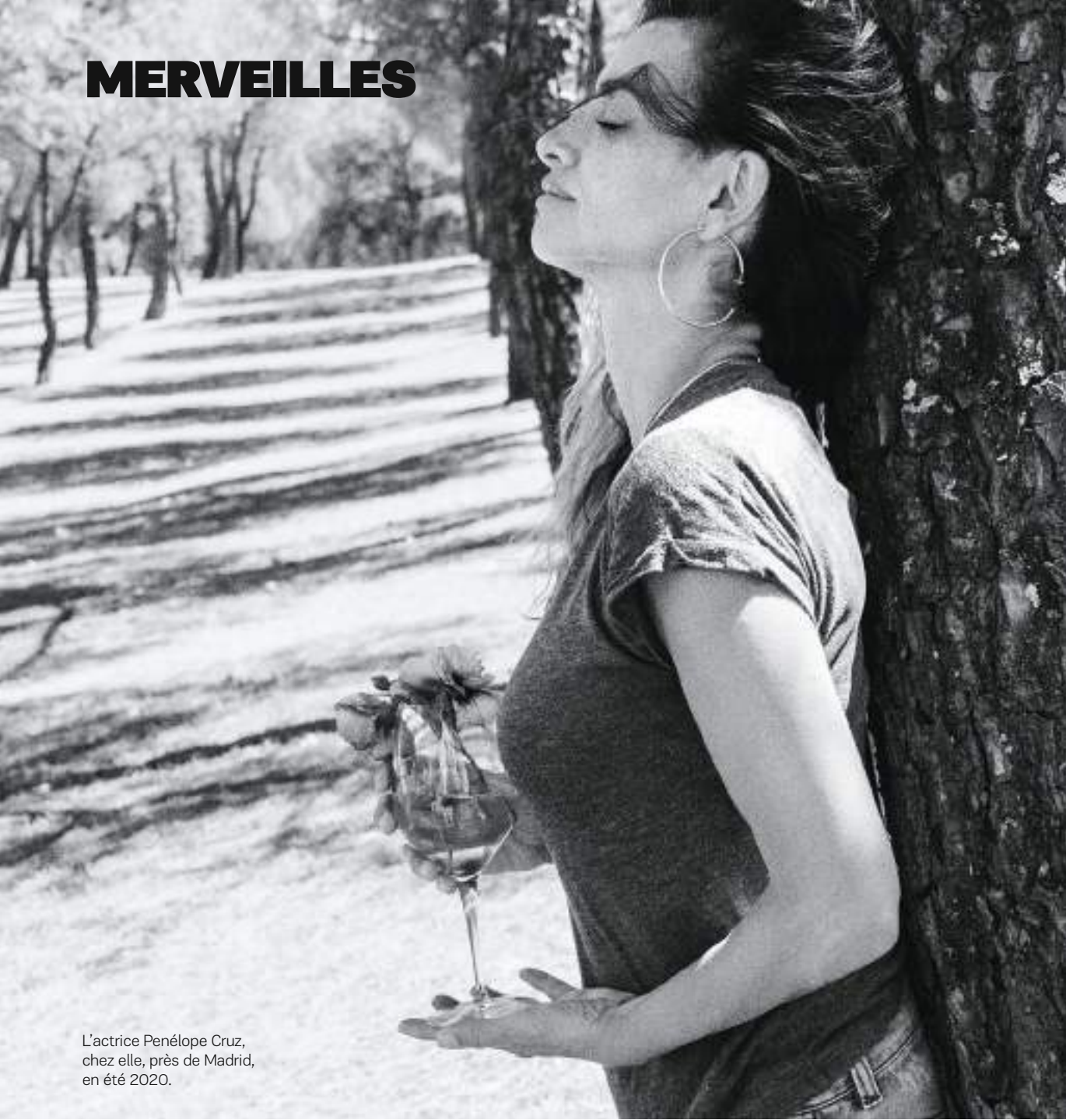
L'actrice Penélope Cruz, chez elle, près de Madrid, en été 2020.