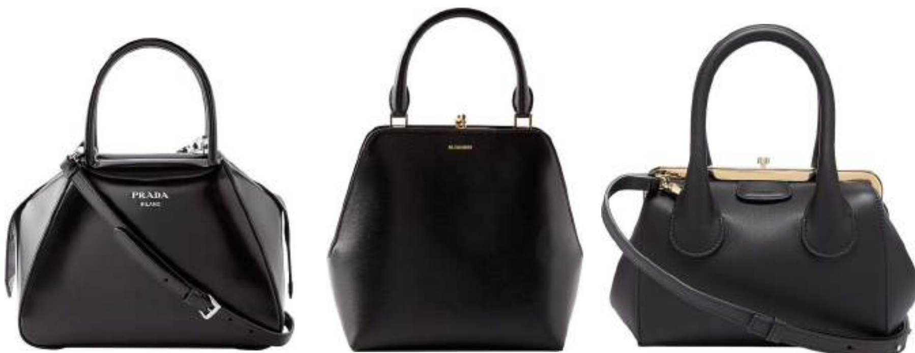
Sac à main en cuir spazzolato, bandoulière amovible, Prada , 2552 fr. Sac à main en cuir noir lisse, à cadre et fermoir dorés, Jil Sander , 1503 fr. Petit sac à main Joyce en cuir, bandoulière amovible, Chloé , 1800 fr.