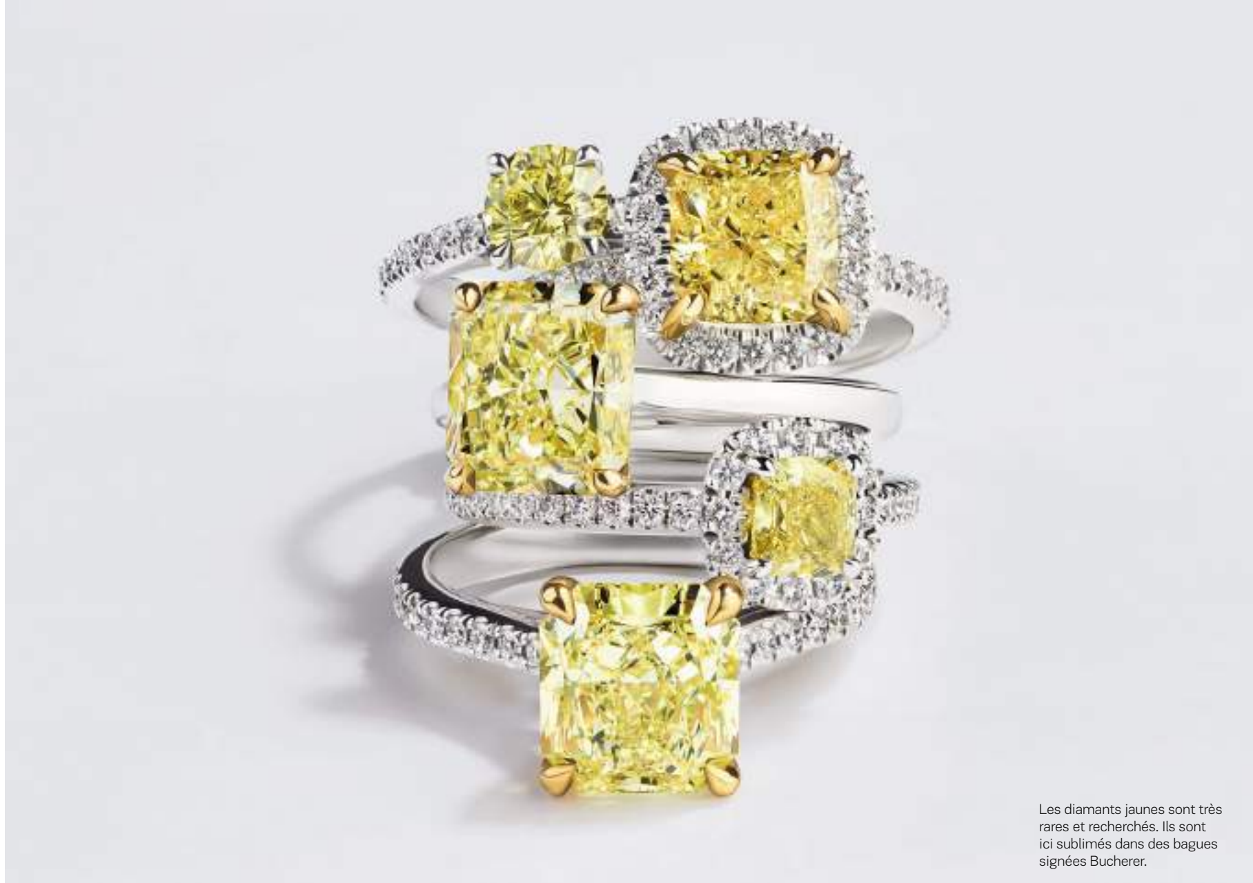
Les diamants jaunes sont très rares et recherchés. Ils sont ici sublimes dans des bagues signées Bucherer.