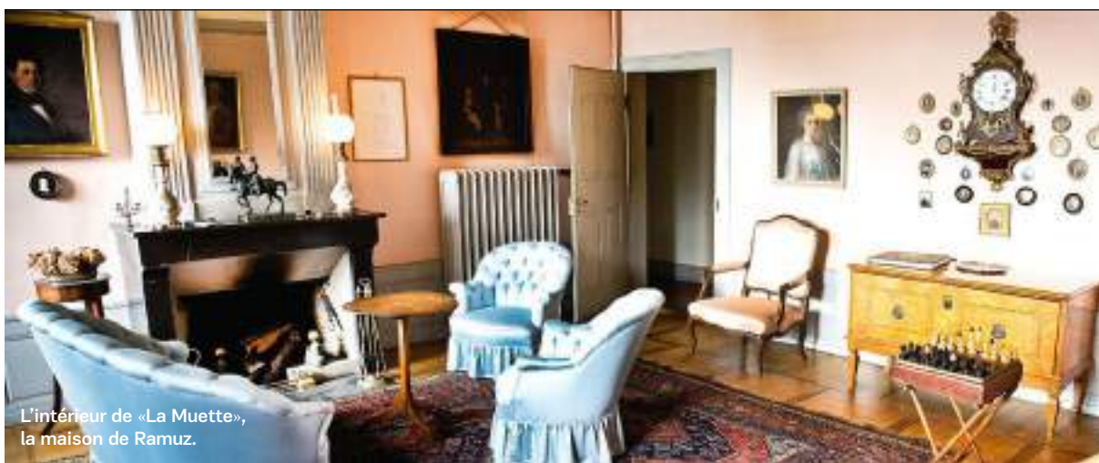
L'intérieur de «La Muette», la maison de Ramuz.