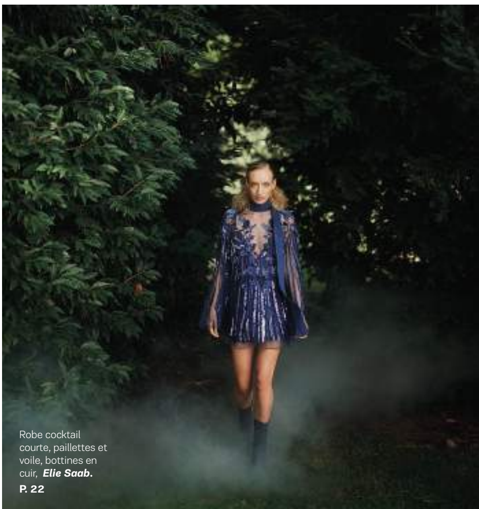
Robe cocktail courte, paillettes et voile, bottines en cuir, Elie Saab. P. 22