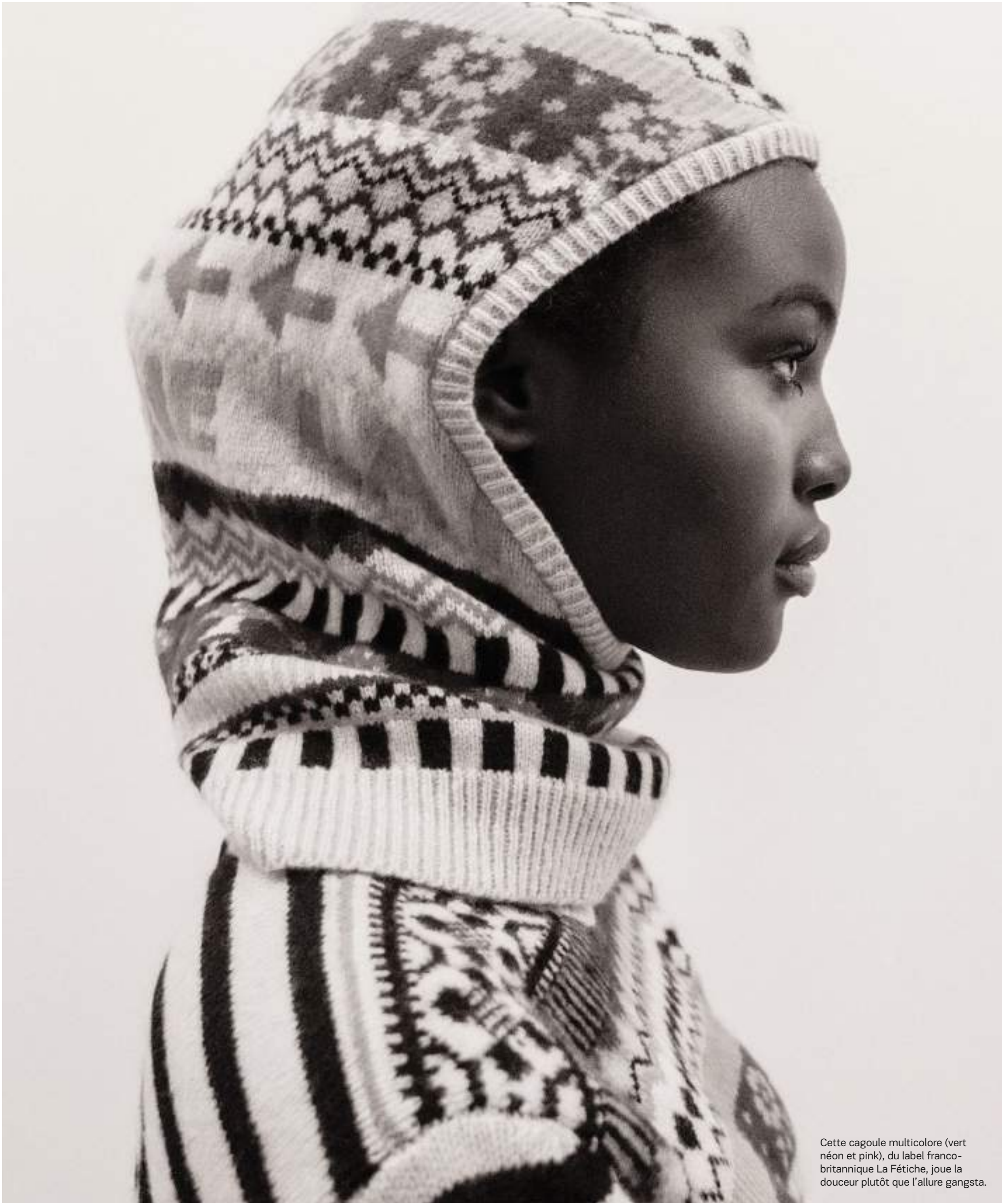
Cette cagoule multicolore (vert néon et pink), du label franco-britannique La Fétiche, joue la douceur plutôt que l'allure gangsta.