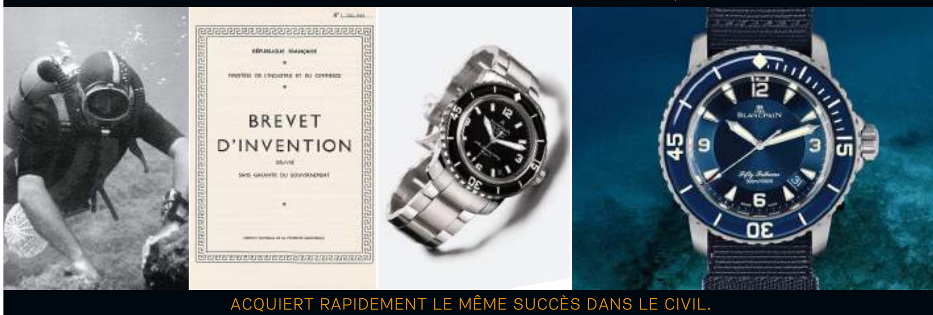
ACQUIERT RAPIDEMENT LE MÊME SUCCÈS DANS LE CIVIL.