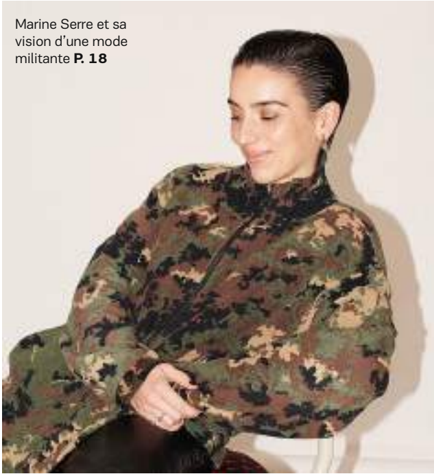
Marine Serre et sa vision d'une mode militante P. 18