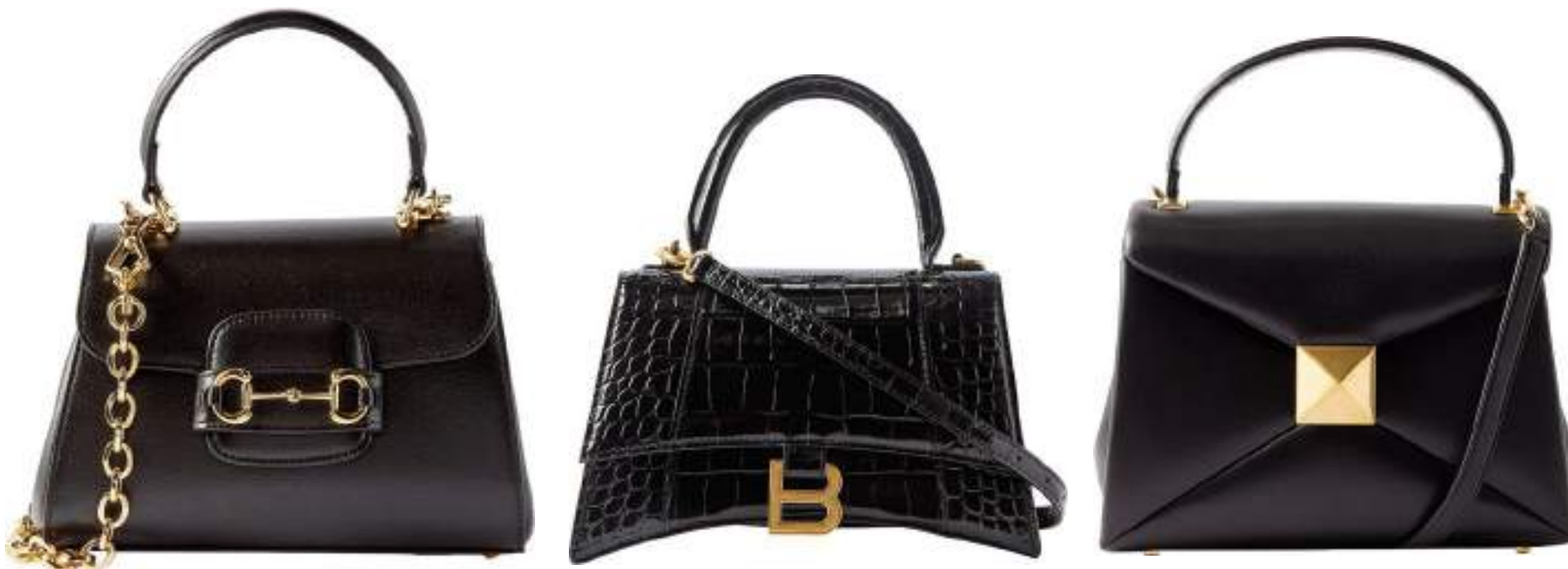
Mini-sac Horsebit 1955, bandoulière chaîne dorée, Gucci , 2840 fr. Sac en cuir effet crocodile Hourglass S, finitions dorées, bandoulière fine, Balenciaga , 2492 fr. Mini-sac à main One Stud en nappa, Valentino , 2730 fr.