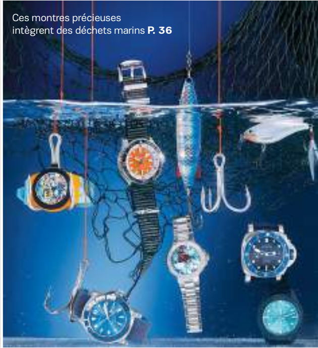
Ces montres précieuses intègrent des déchets marins P. 36