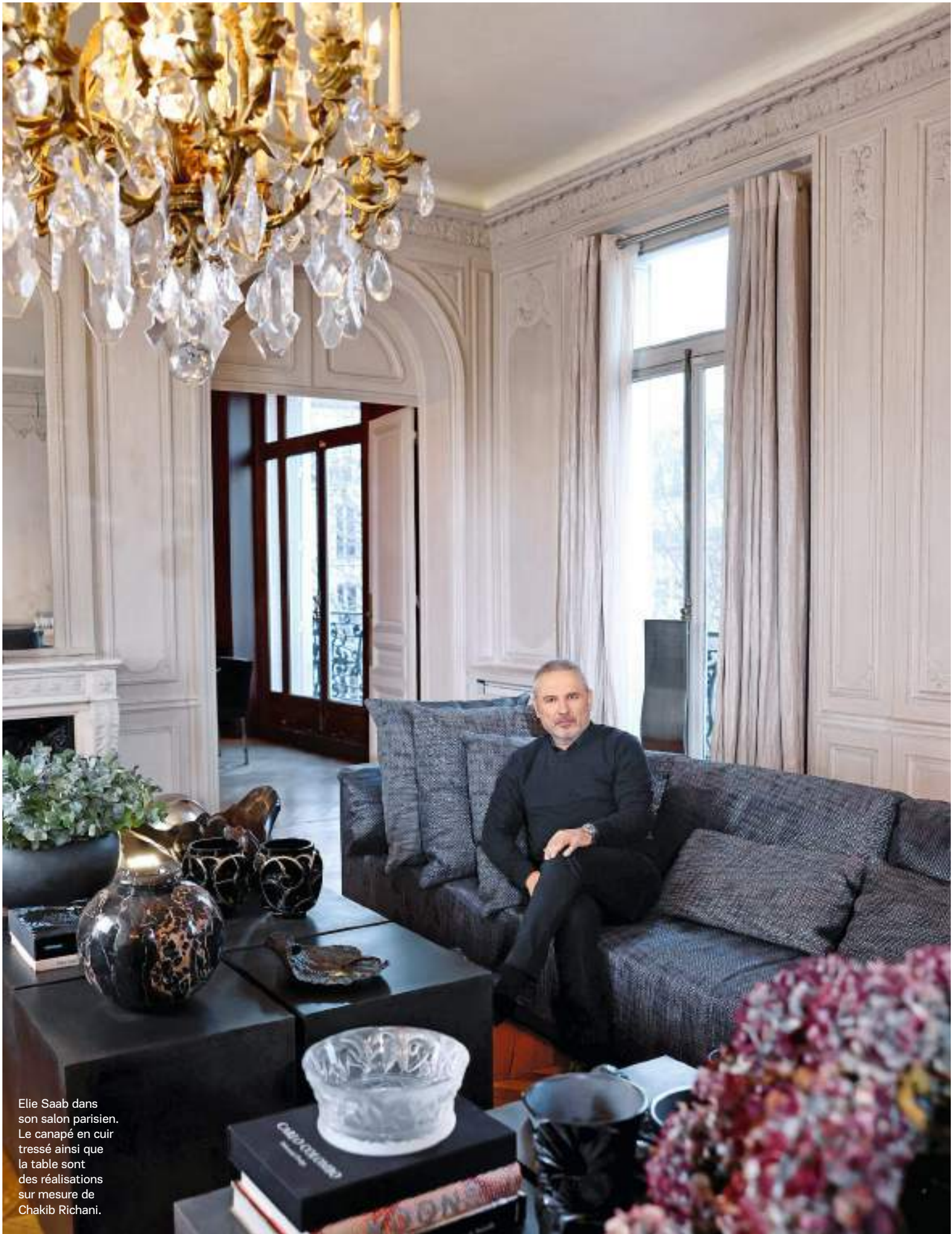
Elie Saab dans son salon parisien. Le canapé en cuir tressé ainsi que la table sont des réalisations sur mesure de Chakib Richani.