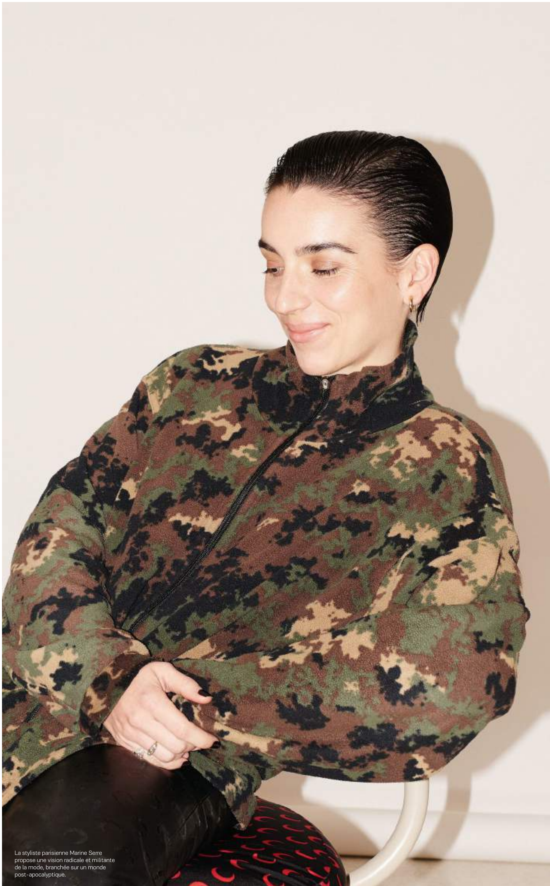
La styliste parisienne Marine Serre propose une vision radicale et militante de la mode, branchée sur un monde post-apocalyptique.