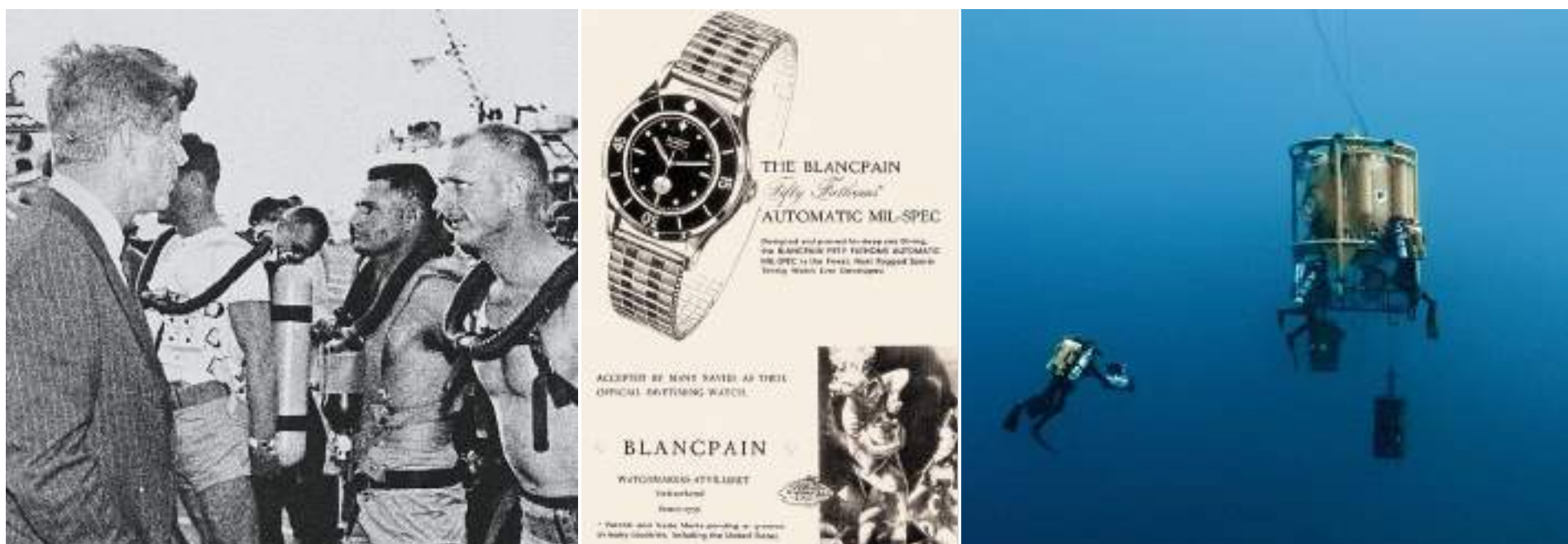
RÉFÉRENCE MONDIALE POUR LES MONTRES MILITAIRES DE PLONGÉE, LA FIFTY FATHOMS