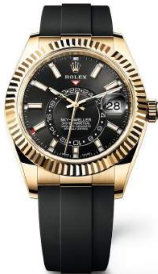
OYSTER PERPETUAL SKY-DWELLER