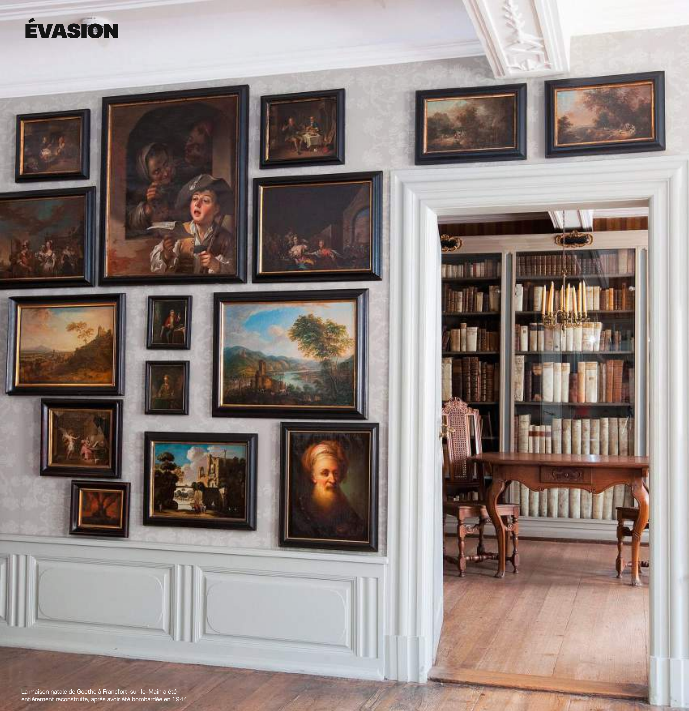
La maison natale de Goethe à Francfort-sur-le-Main a été entièrement reconstruite, après avoir été bombardée en 1944.