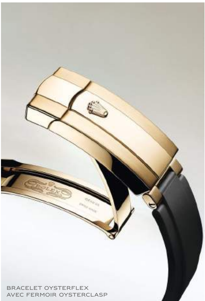
BRACELET OYSTERFLEX AVEC FERMOIR OYSTERCLASP