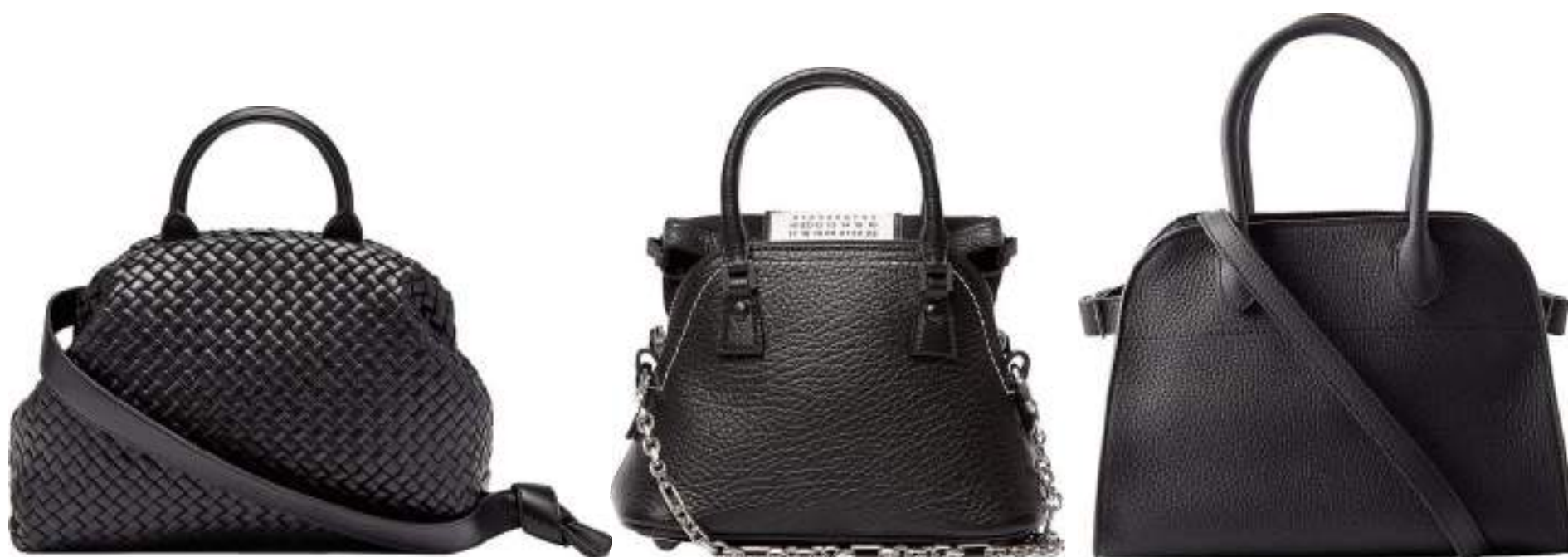
Sac porté épaule et main, en cuir intrecciato, Bottega Veneta , 4207 fr. Mini-sac en cuir 5AC, bandoulière chaîne argentée amovible, Maison Margiela , 1892 fr. Sac en cuir grainé Margaux 10, The Row , 2819 fr.