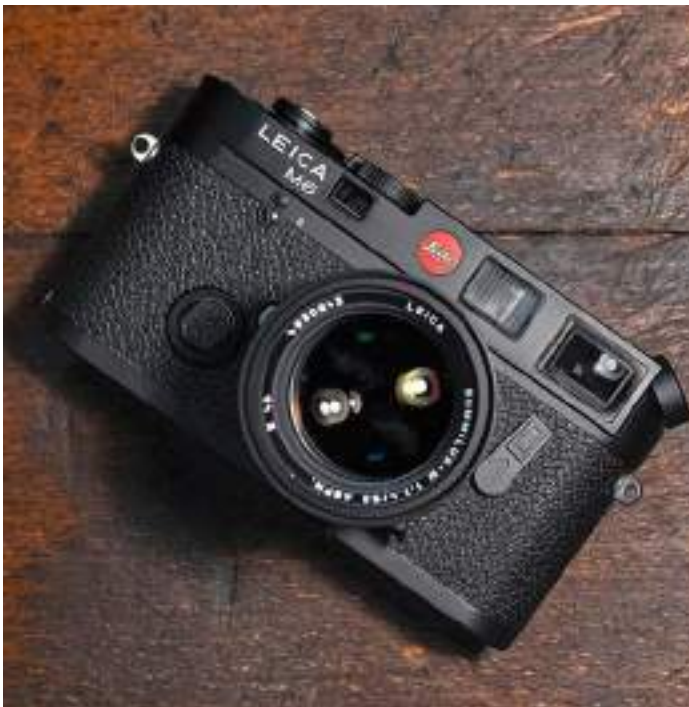
Leica M6, réédition du modèle de 1984, 5550 fr.

Jamais il ne vous viendrait à l'esprit qu'une merveille technologique de 1984 puisse avoir passé le millénaire pour surgir dans notre présent compliqué. Pourtant Leica ressort son succès tonitruant de cette année-là, le M6: un appareil photo utilisant de la pellicule qu'il faut développer plus tard, une machine sans écran et sans électronique, des réglages via des molettes physiques dont le résultat n'est pas repris dans le viseur, ou plutôt les viseurs, (il y en a étrangement deux), sans autofocus, au prix tout simplement faramineux et fabriqué