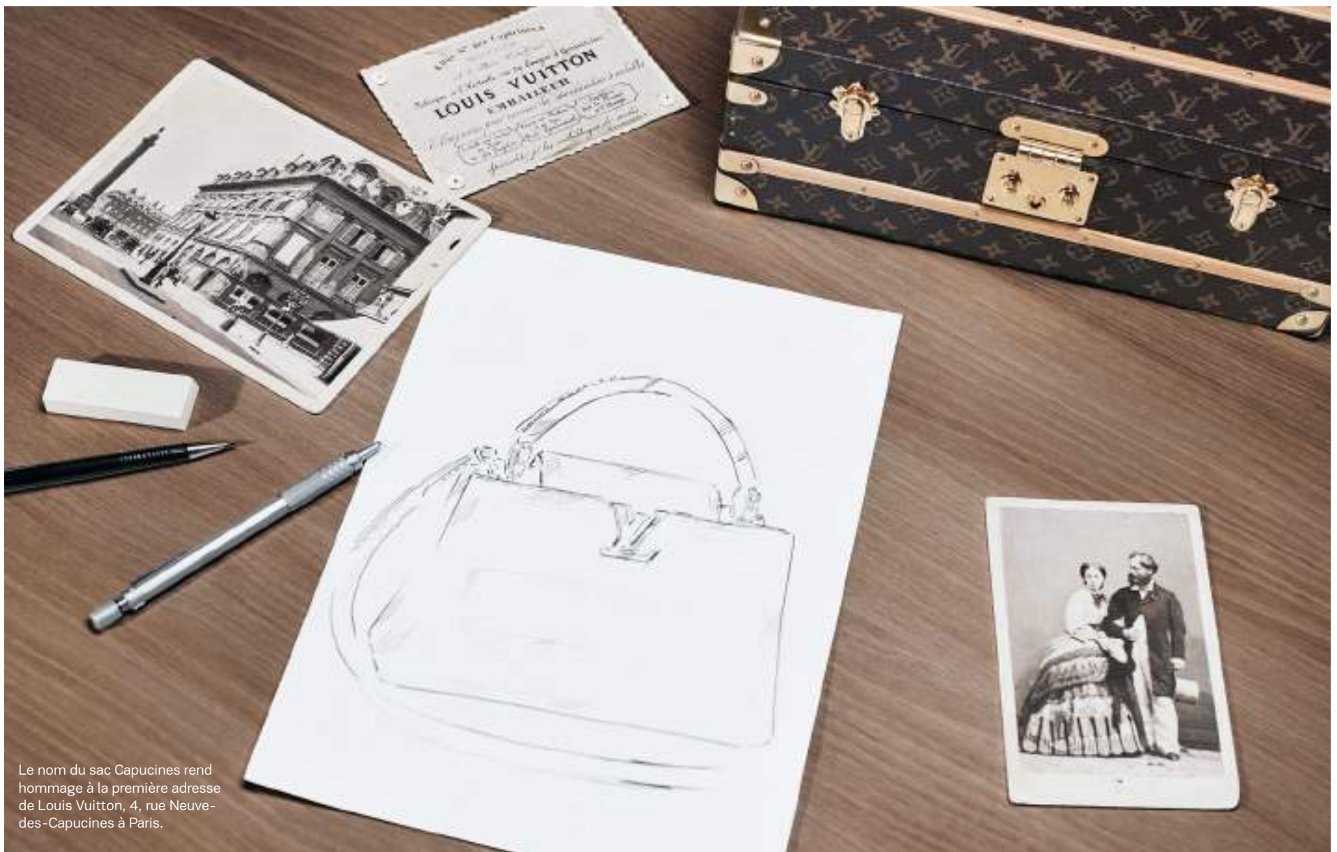
Le nom du sac Capucines rend hommage à la première adresse de Louis Vuitton, 4, rue Neuve-des-Capucines à Paris.