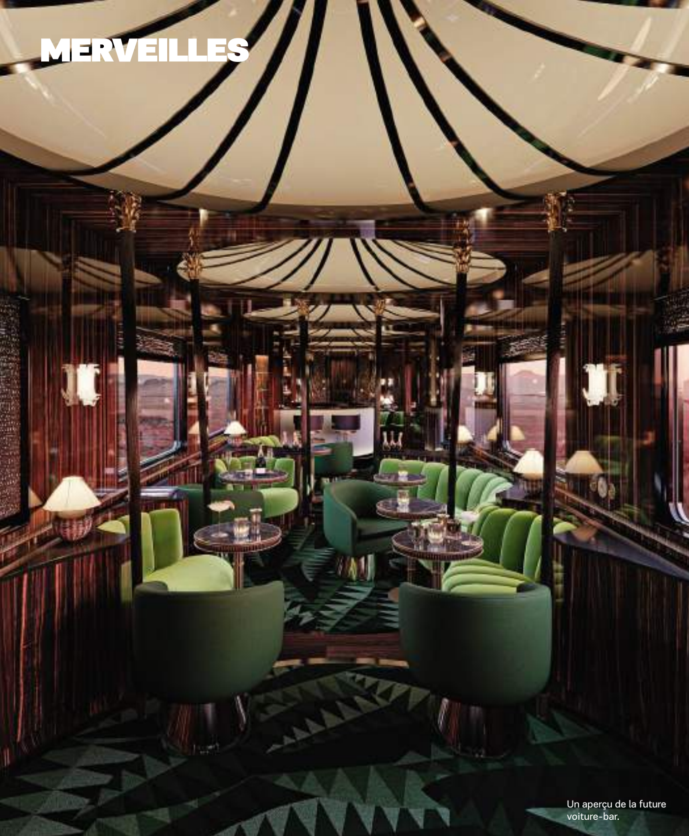
Un aperçu de la future voiture-bar.