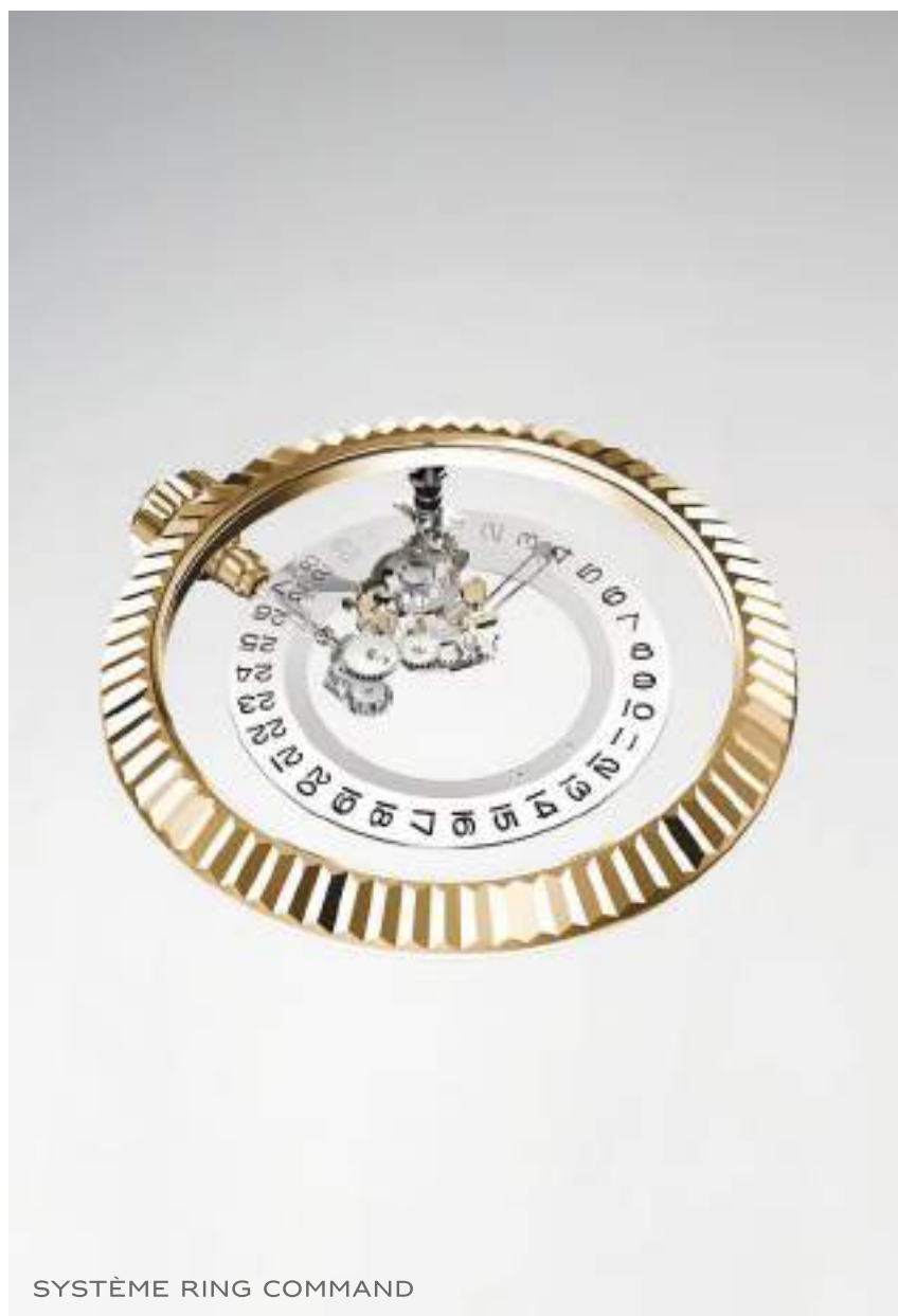
SYSTÈME RING COMMAND