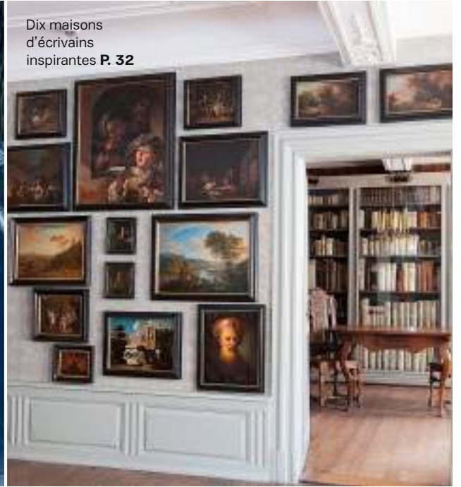
Dix maisons d'écrivains inspirantes P. 32